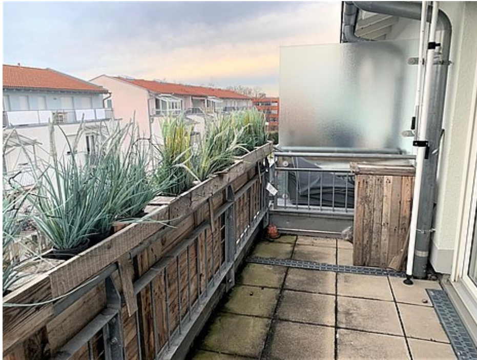
Dachterrasse Ansicht 1