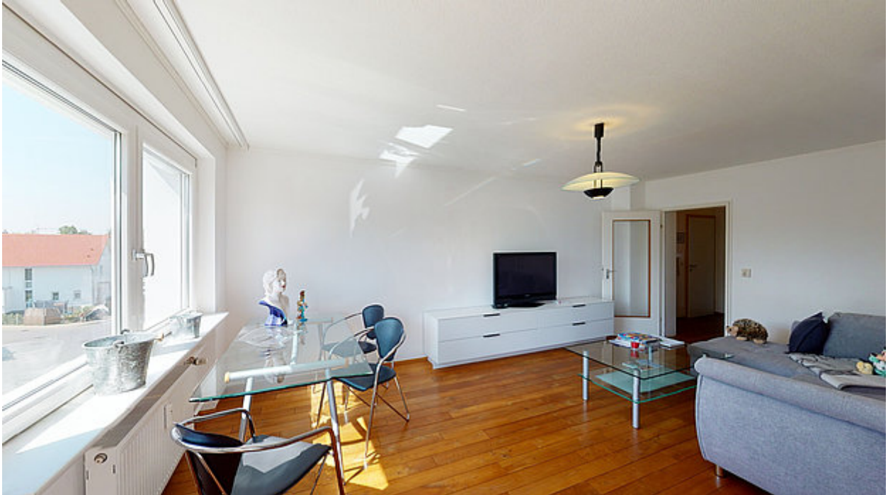
Wohnzimmer Ansicht 2