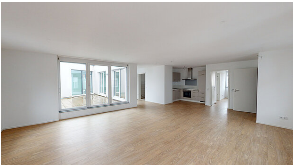
Wohnzimmer Ansicht 2