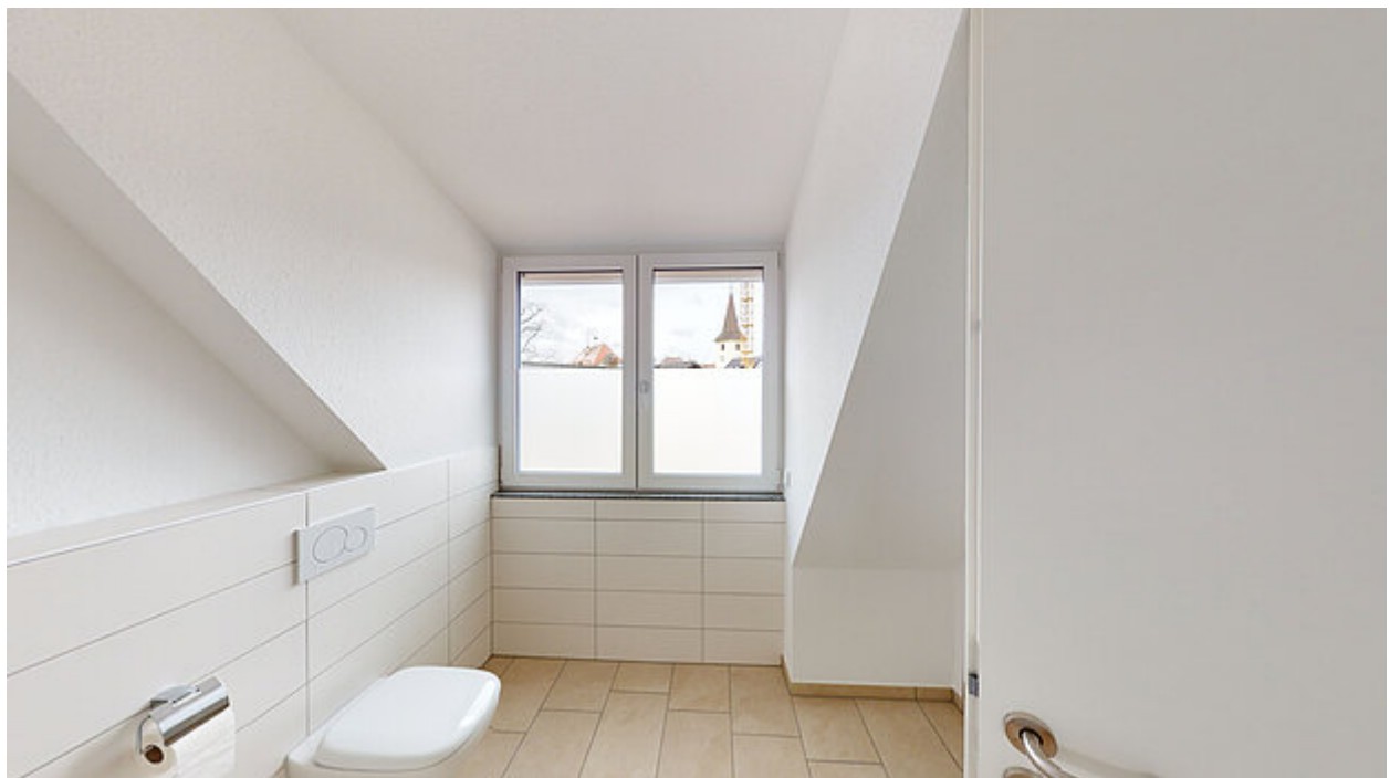
Badezimmer 1 Ansicht 2