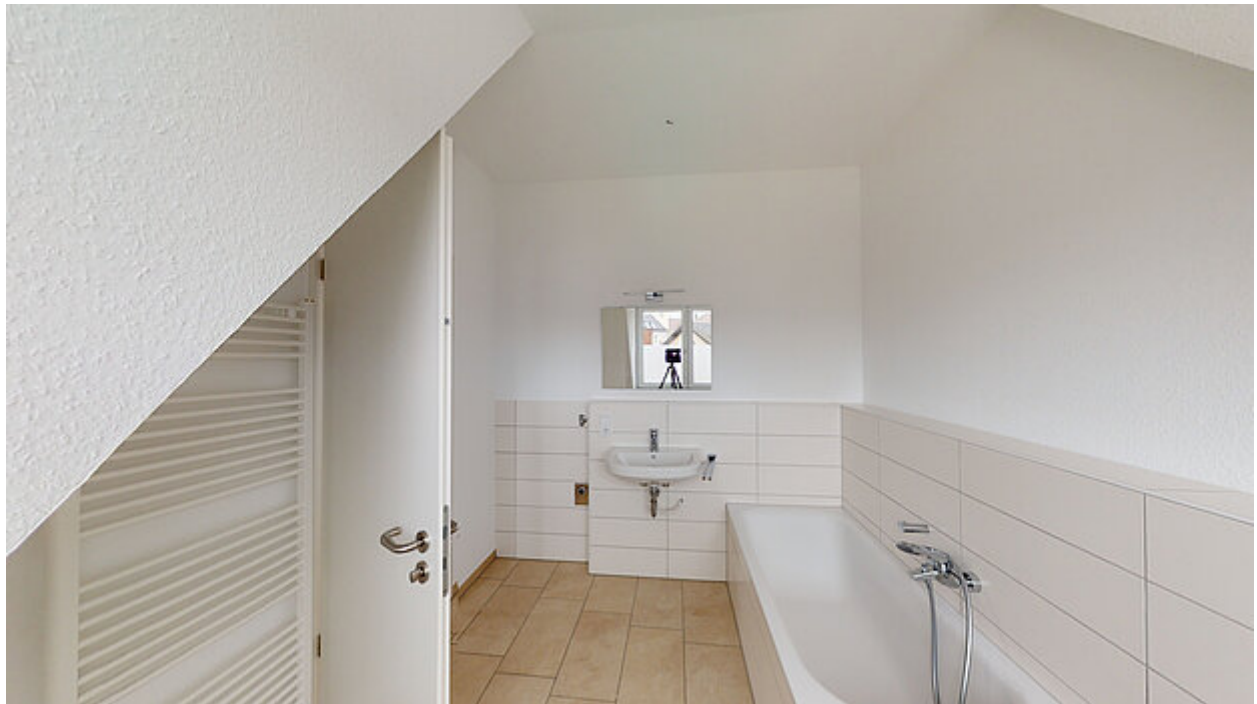
Badezimmer 1 Ansicht 1