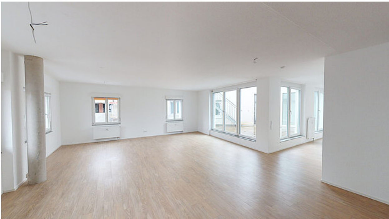
Wohnzimmer Ansicht 1