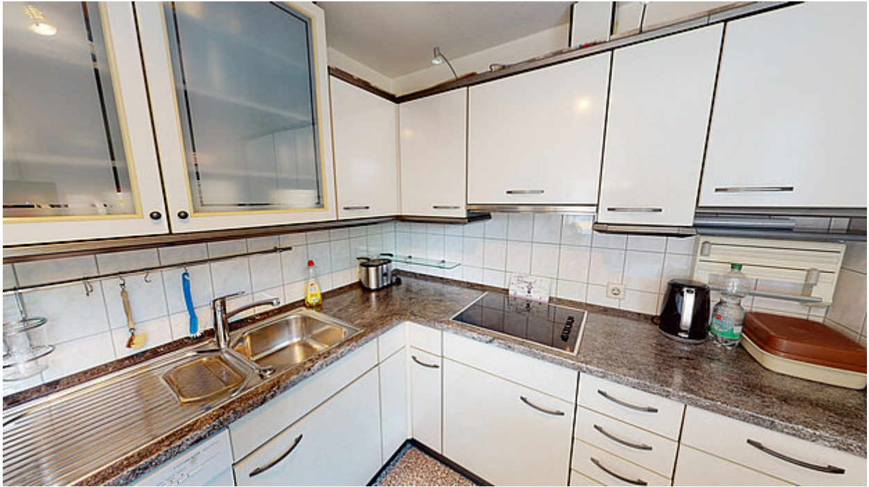
Küche Ansicht 2