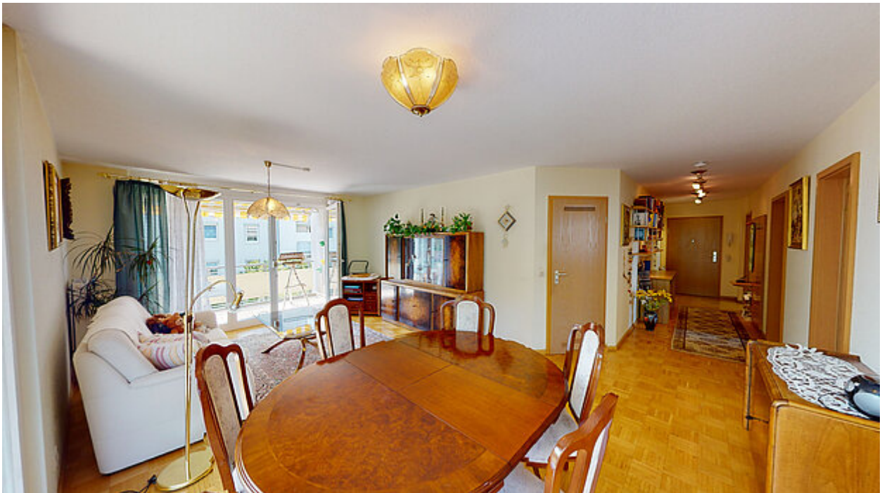
Wohnzimmer Ansicht 2