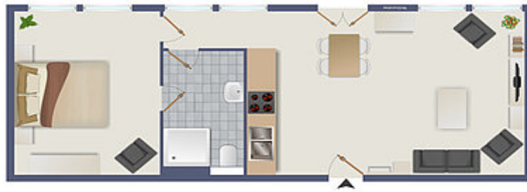
1813 Grundriss gestaltet