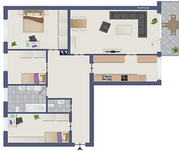
1863 Grundriss gestaltet