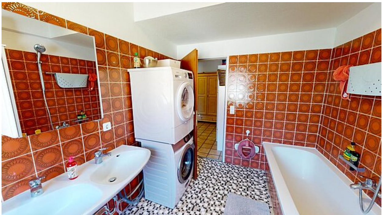
Badezimmer Ansicht 2