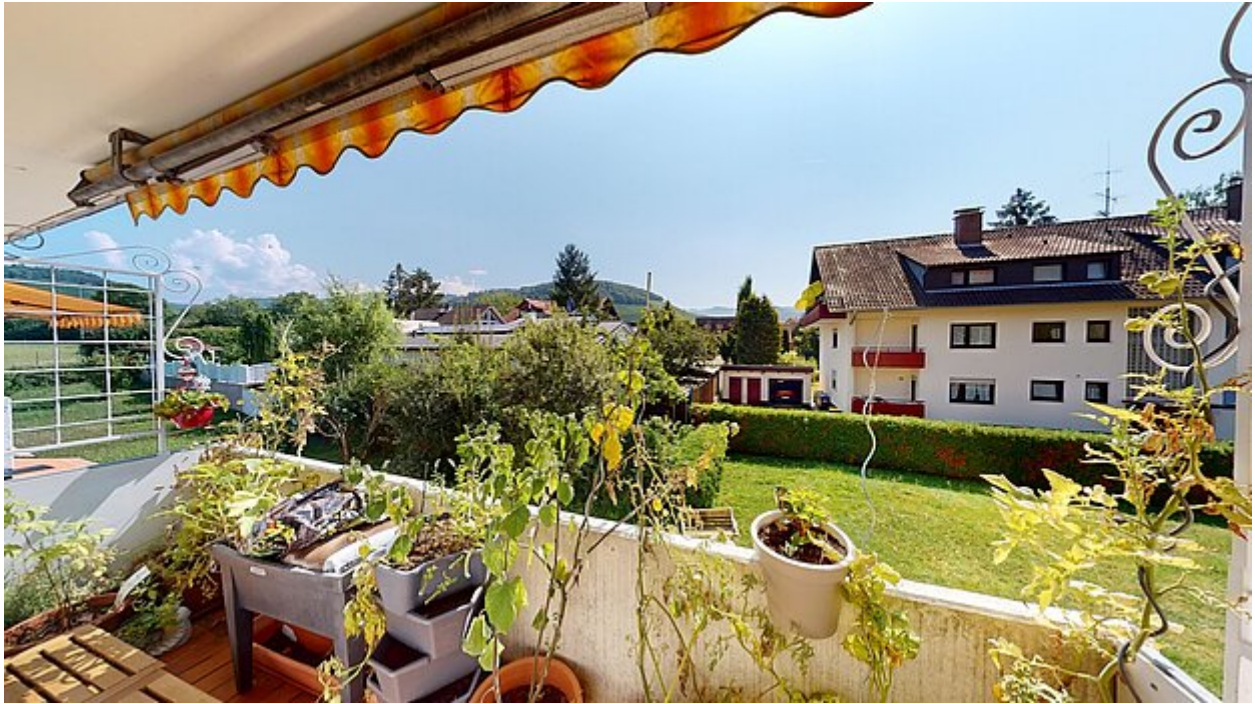
Klasse Aussicht vom Balkon