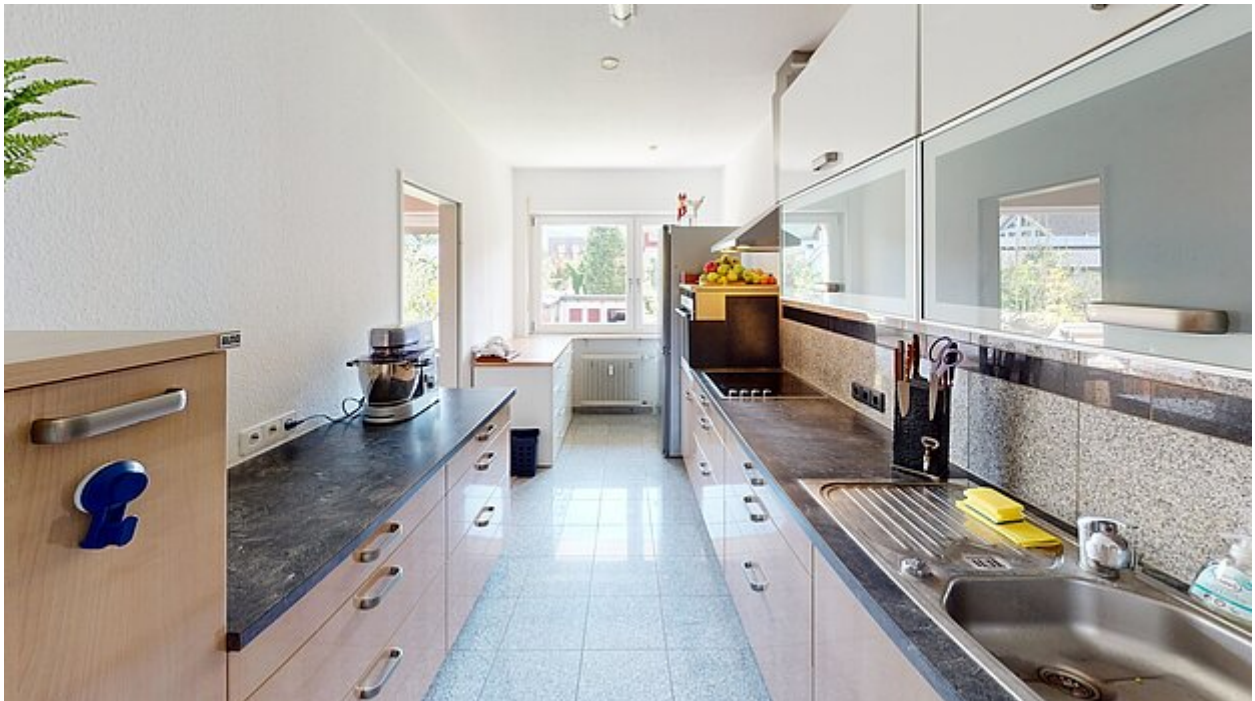
Küche Ansicht 1