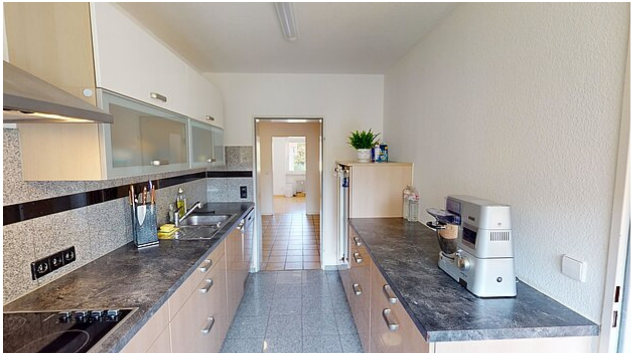
Küche Ansicht 2