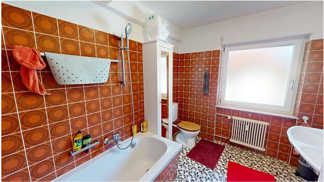
Badezimmer Ansicht 1