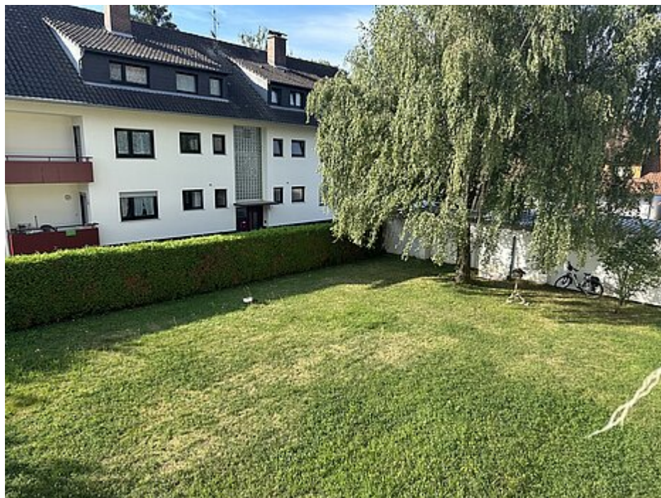
Blick in den Garten vom Balkon