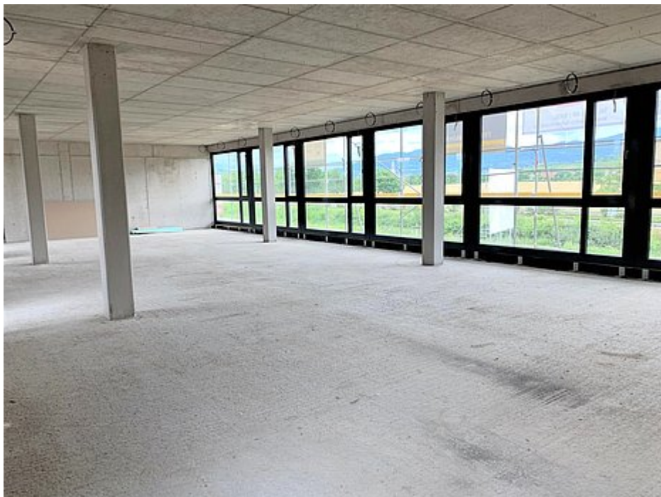
Bürofläche im 1.OG Ansicht 2