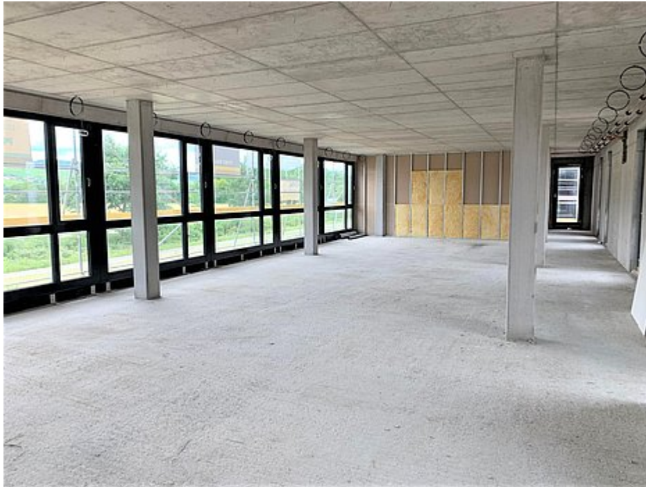
Bürofläche im 1.OG