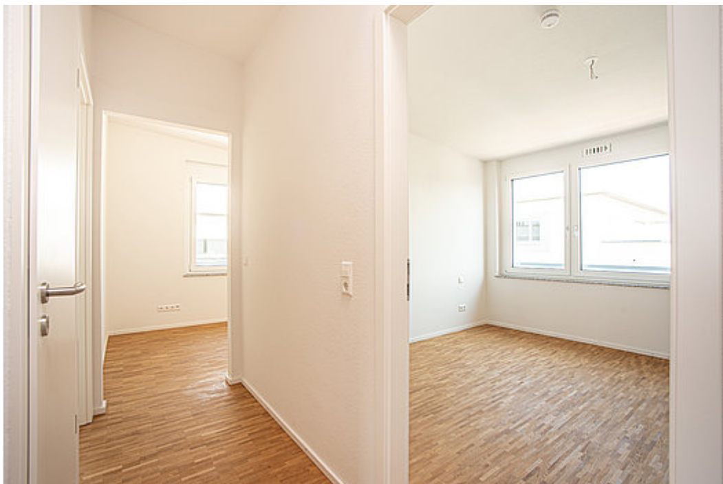
Blick in die Schlafzimmer