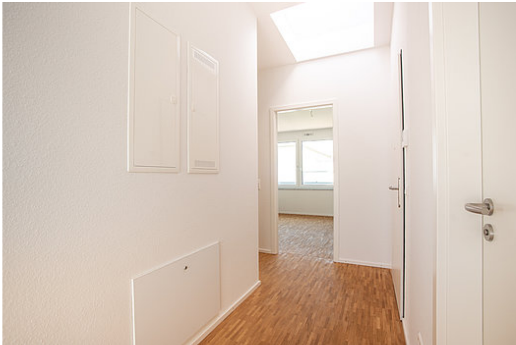
Flur mit Lichtschacht