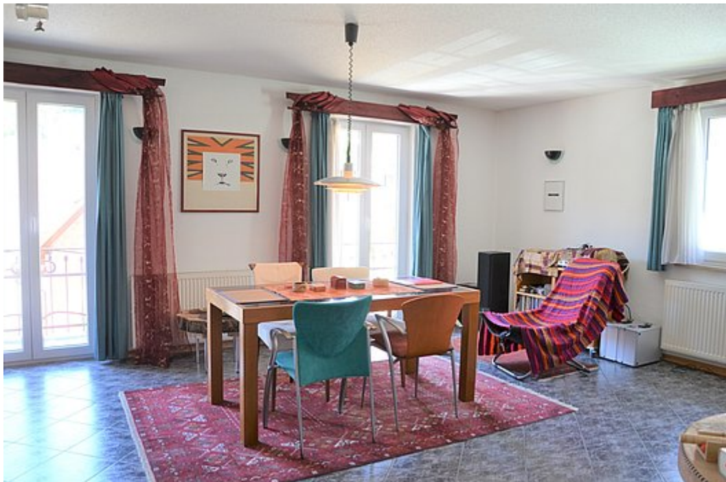
Wohn- und Essbereich