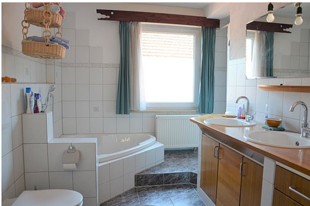
Badezimmer mit Fenster