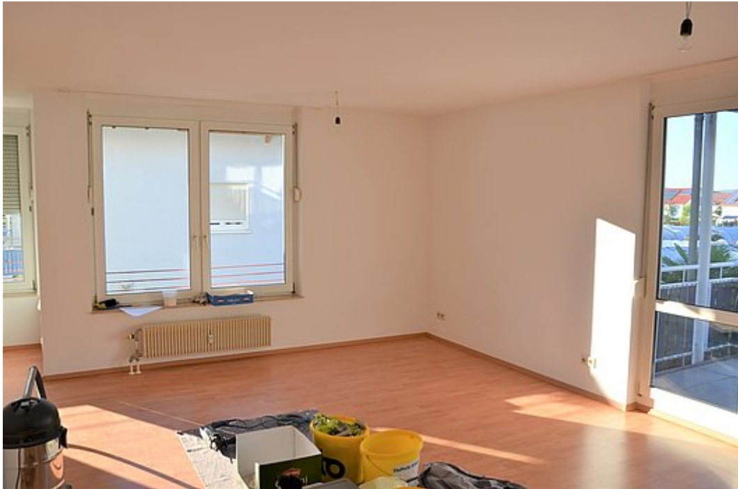
Wohnbereich Ansicht 1