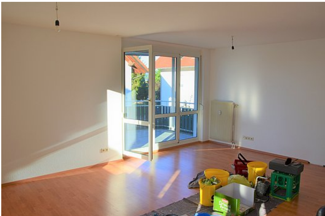
Wohnbereich Ansicht 2