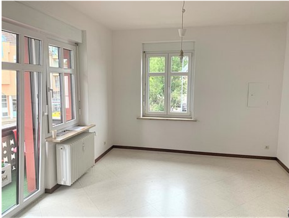
Wohnzimmer Ansicht 1