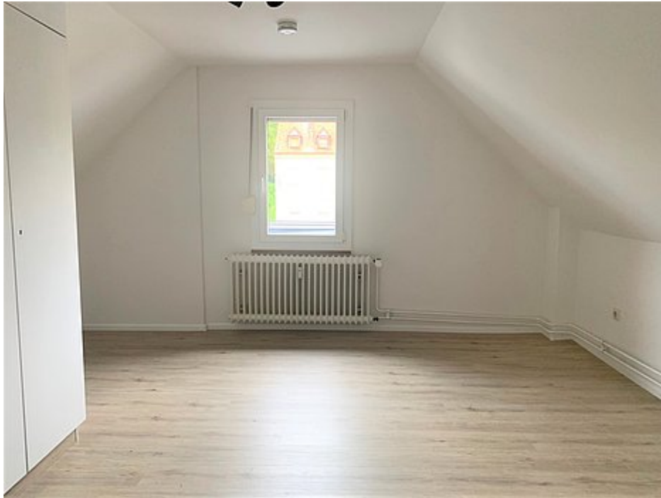
Schlafzimmer 1 im DG