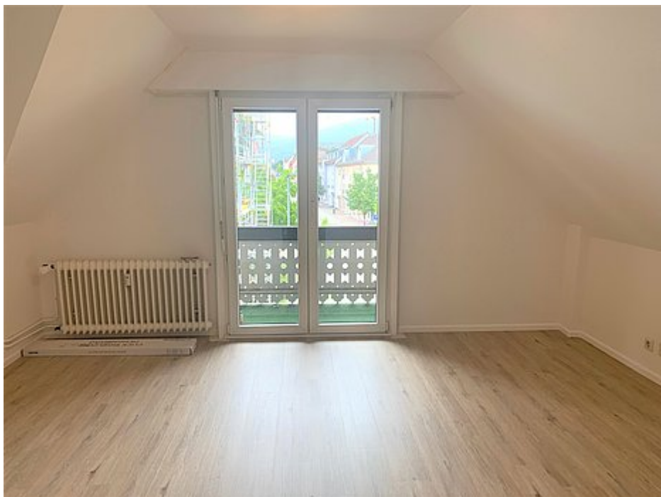
Schlafzimmer 2 mit Balkon