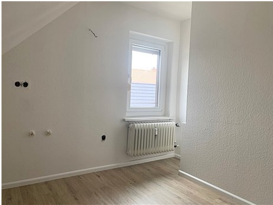
Schlafzimmer 3 im DG