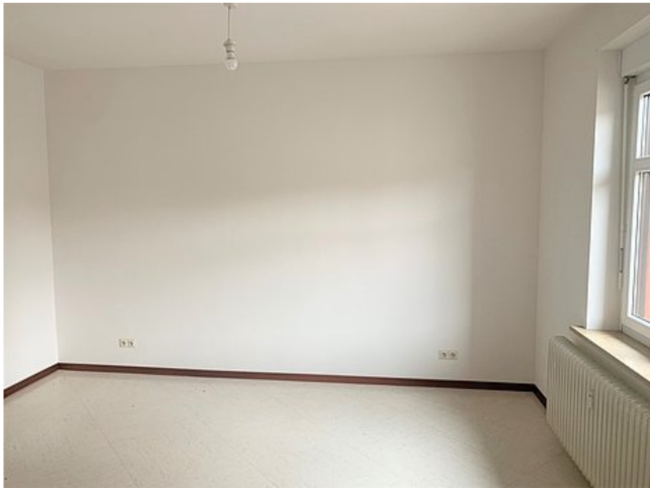
Schlaf-/Arbeitszimmer im OG