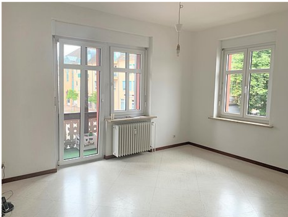
Wohnzimmer Ansicht 2