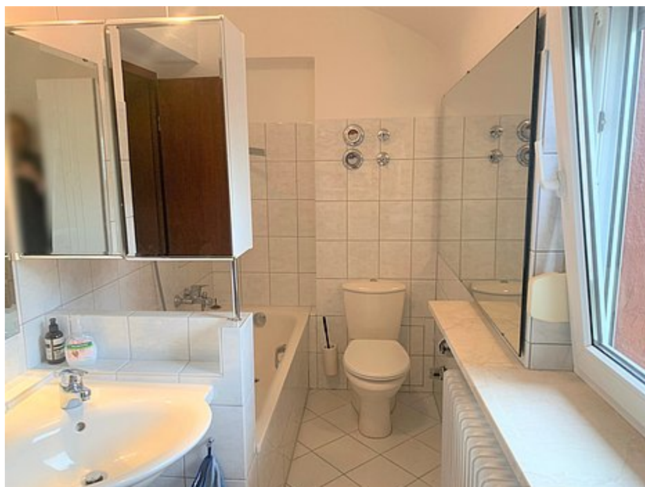
Badezimmer im OG